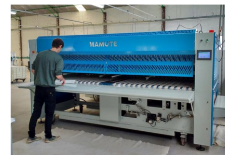
Dobradeira em funcionamento