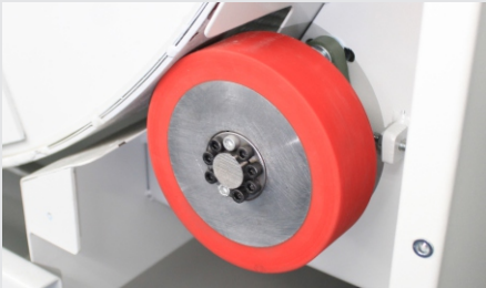
ROLETES DE TRANSMISSÃO MECÂNICA

Câmara de aquecimento montada com resistências tubulares aletadas, com maior área de dissipação do calor gerado. As resistências são montadas em sistema de blocos, com 5,5 kw e 3 resistências em cada bloco, facilitando a sua troca e/ou manutenção. Sua montagem compacta evita passagem de ar frio entre as resistências, aquecendo por igual e economizando energia no processo de secagem. Controle automático da temperatura no próprio painel do secador, ligando e desligando a câmara de acordo com a temperatura desejada.