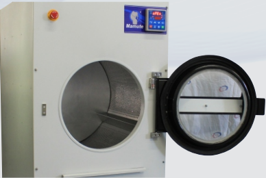
AMPLA ABERTURA DE PORTA Facilita as etapas de carga e descarga